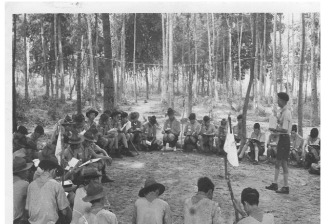
Thuyết giảng tại khóa huấn luyện